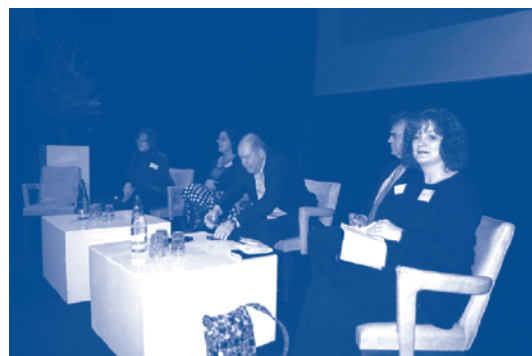
Presentatie Verslag Fondsenwerving in Rotterdam