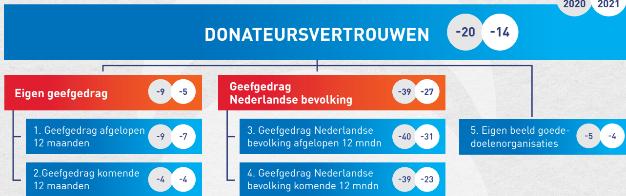
Figuur 2: Samenstelling donateursvertrouwen, december 2020 (links in grijze cirkel) vs. maart 2021 (rechts in witte cirkel). De samenstelling van de cijfers in de rode rij is het gemiddelde van de twee bijbehorende blauwe vragen. Het donateursvertrouwen wordt berekend door het gemiddelde van de vijf blauwe vragen te nemen.