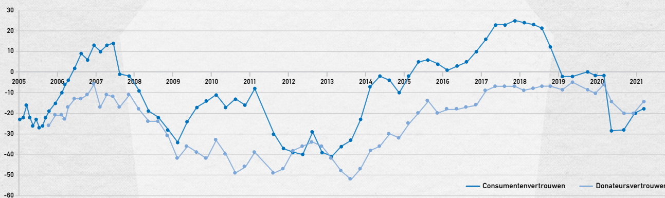
Figuur 1: Ontwikkeling van donateurs- en consumentenvertrouwen 2005-2021

Het donateursvertrouwen is in maart gestegen ten opzichte van december 2020. Het gaat van -20 toen naar -14 nu. Daarmee lijkt het donateursvertrouwen langzaam omhoog te klimmen. Het consumentenvertrouwen is ook iets gestegen, maar niet zo hard als het donateursvertrouwen. Het gaat van -20 naar -18.